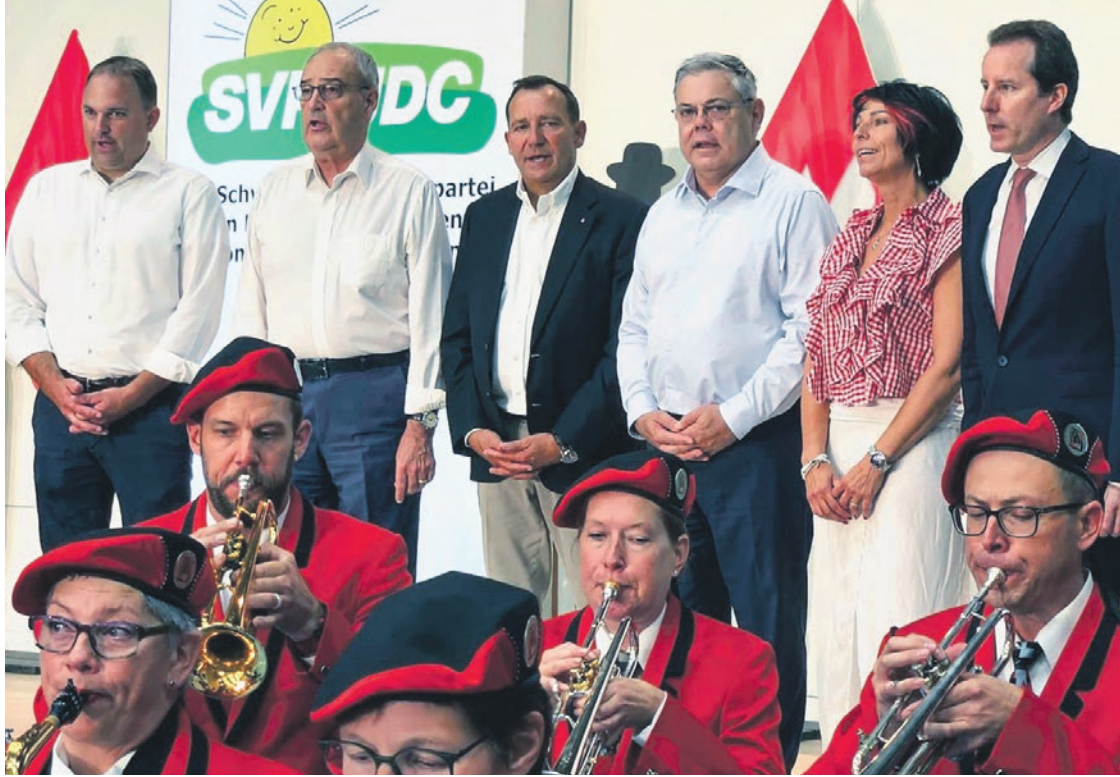
Les ténor-es du parti chantent lors de l'assemblée des délégué-es de l'UDC, Schaffhouse, 16 août 2025

National Votations Racisme Immigration «SUISSE À 10 MILLIONS»