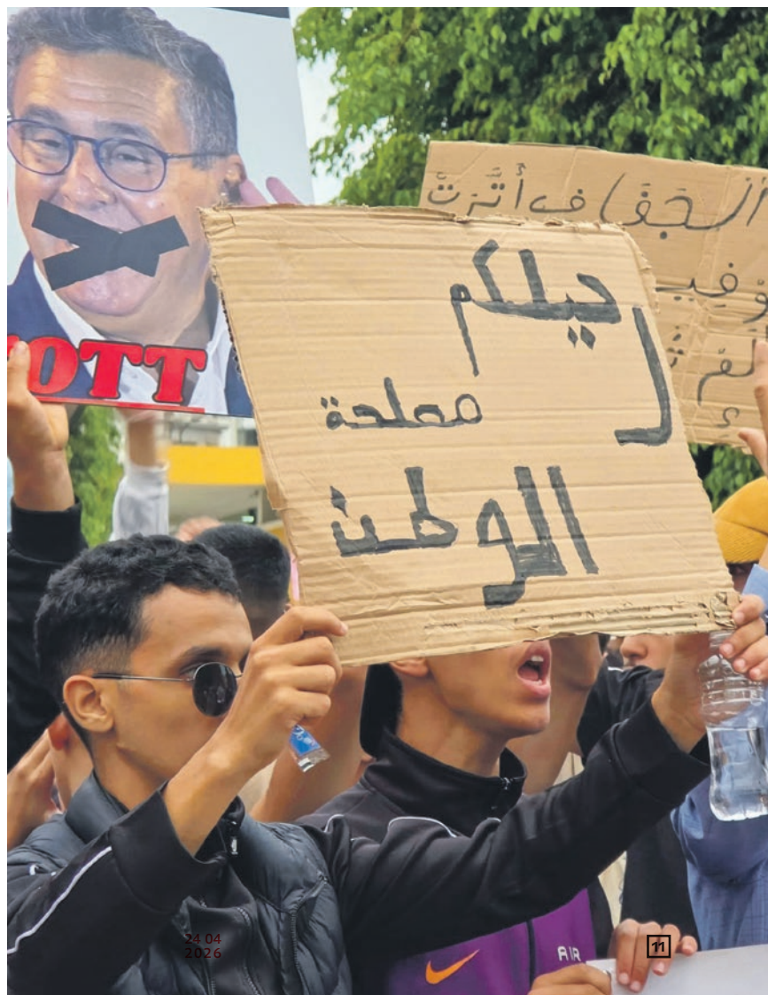
Manifestation du mouvement Gen Z 212, Casablanca, 10 octobre 2025.