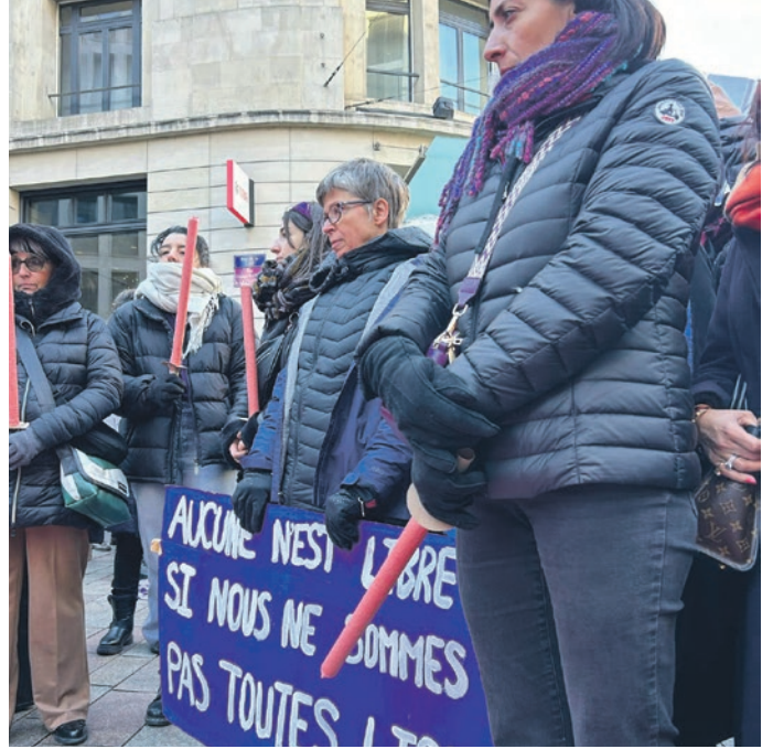
Rassemblement contre les violences sexistes, Genève, 25 novembre 2023

Sources : OFS, Eurostat, touteurope.eu. Sandro Favre, Reto Föllmi, Josef Zweimüller, « L'immigration a un impact positif sur le premier pilier », sozialesicherheit.ch, 30 novembre 2023)