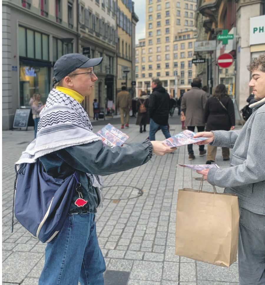
La distribution de notre journal devrait être une tâche militante prioritaire. Stand de campagne, Lausanne, 14 février 2026.