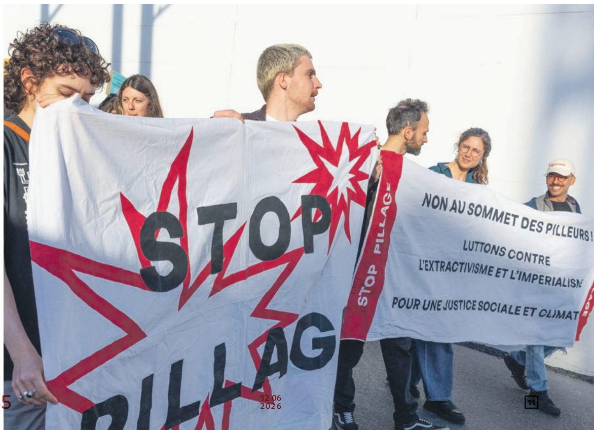
Manifestation contre le Commodities Global Summit, Lausanne, 19 avril 2026